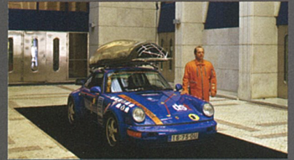
"Project Ariete" 2005