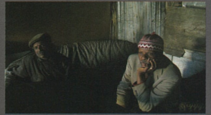
"Tarrafal" 2007