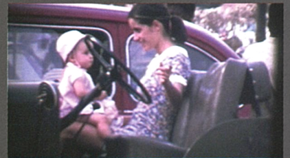
"Nostalgia" 2004. DVD, colour, sound, 17min 43sec ©Maria Lusitano

Miguel Palma's (born 1964, lives and works in Portugal) unique style of installation consisting of cars, planes, or large-scale toy-like devices, coupled with video documentation, is filled with the innocence of a child who is absorbed in playing with toys.