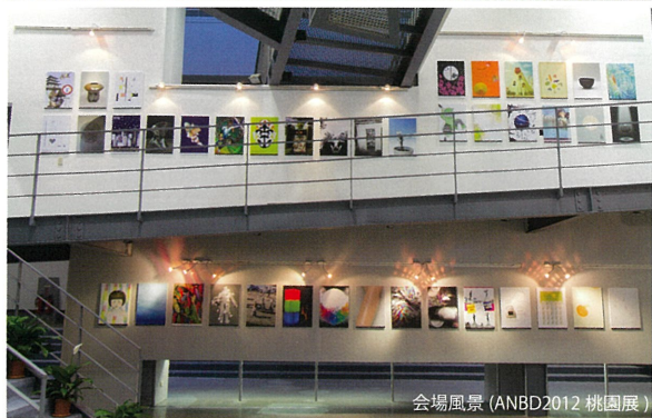
会場風景 (ANBD2012 桃園展)