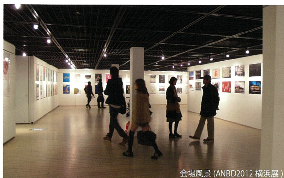
会場風景 (ANBD2012 横浜展)

本展では、“未来へ向けたアジア文化遺産”をテーマとする290人の作品を展示いたします。文化遺産は形を成しているものばかりではありません。地域に継承される独自の伝統芸能や工芸技術、風俗習慣や年中行事、風土に根差した民俗技術など、形をなさないものや固有の精神性をあらわす無形の文化遺産は無数に存在しています。このような文化は過去から積み重ねられて今にいたり、また今から未来へ向けて受け継がれ、かけがえのない遺産となってゆきます。今年のANBDは無形の文化遺産に着目して制作テーマを設定しました。東アジアの作家たちは、これらをどのようにとらえ、どのようにビジュアライズしているのか。それぞれの作品に込められた“未来へ向けたアジア文化遺産”への思いを見出していただければ幸いです。なお、本展の会場では、各地域作家による個展も併せて開催いたします。