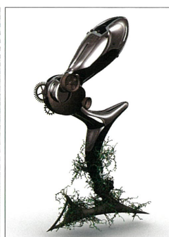
岡野正信 「OLD AND NEW CRAFT」