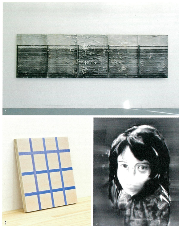
1. 金光男《row - ami》2012 2. 加納 俊輔《layer of my labor_02 (PP band on lumber)》2011 3. 田口 健太《繰り返しのポートレート no.1》2011

本年度における展覧会は女子美術大学との共催事業として、当大学附属の女子美アートミュージアムで開催します。また、本展は町田市立国際版画美術館で開催される「第37回全国大学版画展」と同時開催となります。こちらも併せてご覧いただくと今日の多様化した版画表現の実情をご理解いただけることでしょう。皆様のご来場をお待ちしています。