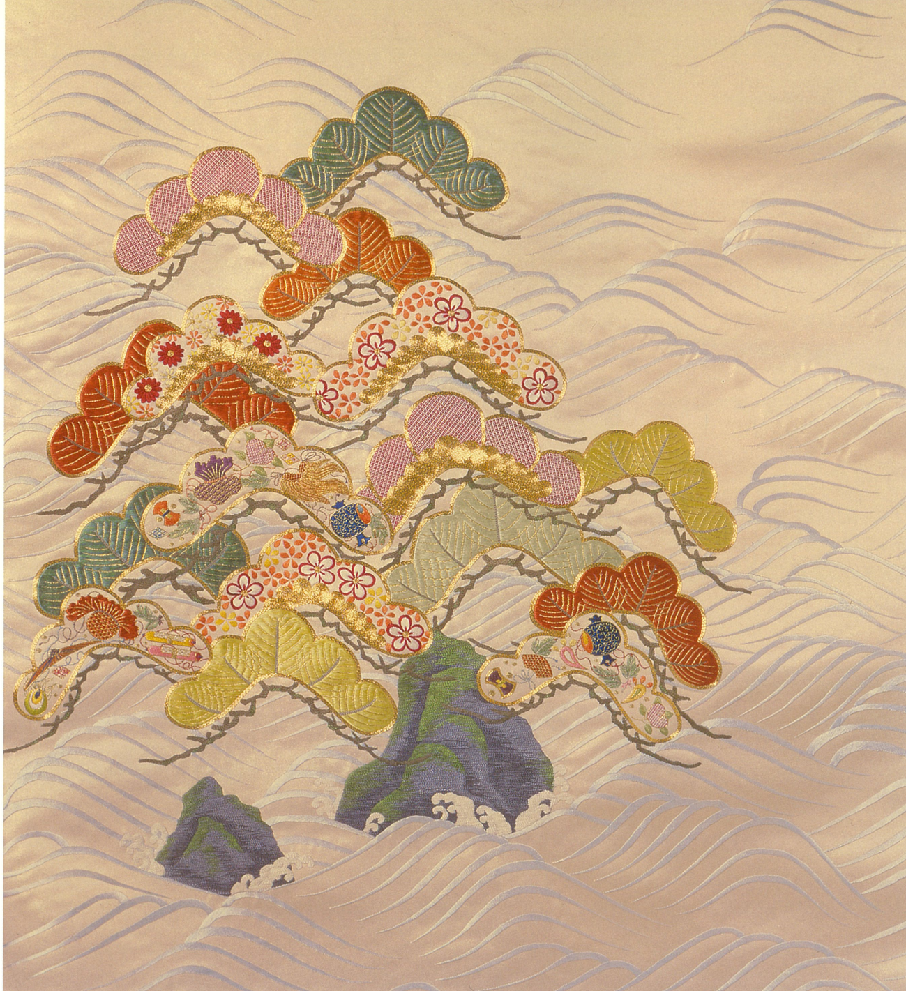
《袋帯 逢菜山》共同制作(技法刺繍)