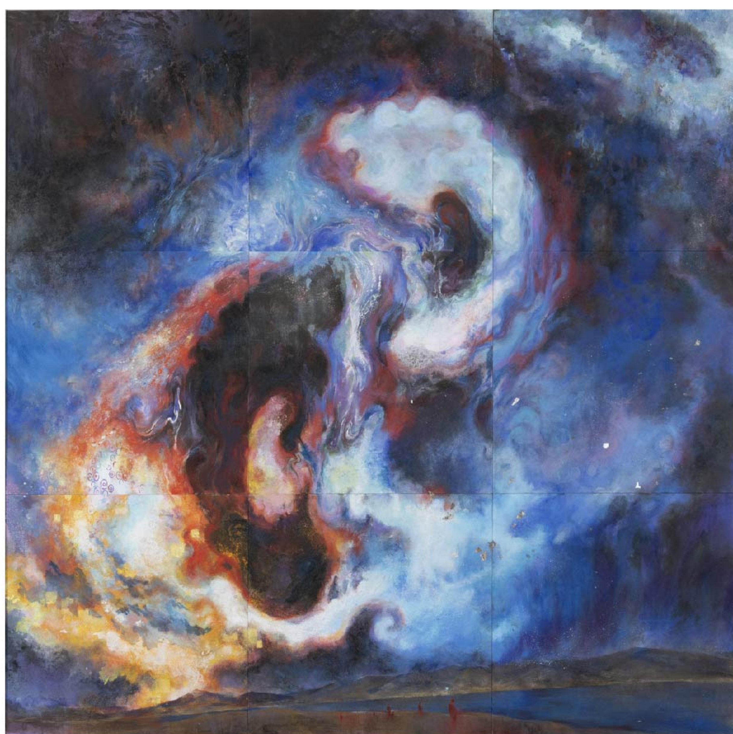
クラインノツボ 紙本着彩