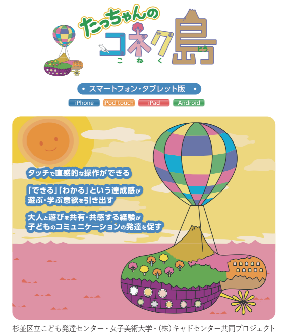
杉並区立子ども発達センター・女子美術大学・(株)キャドセンター共同プロジェクト