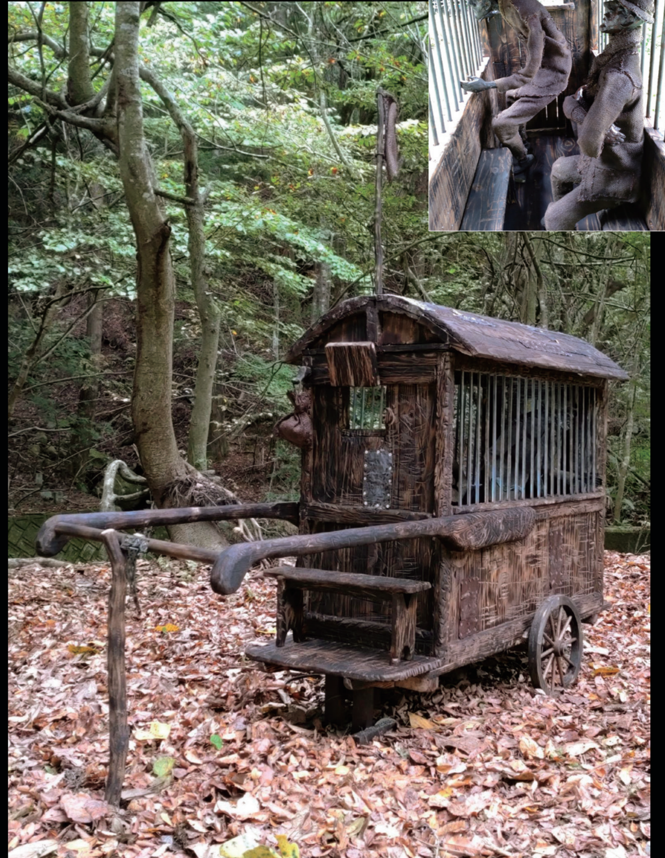
《Merry Christmas and Happy New Year》 H180cm 2022年 64歲