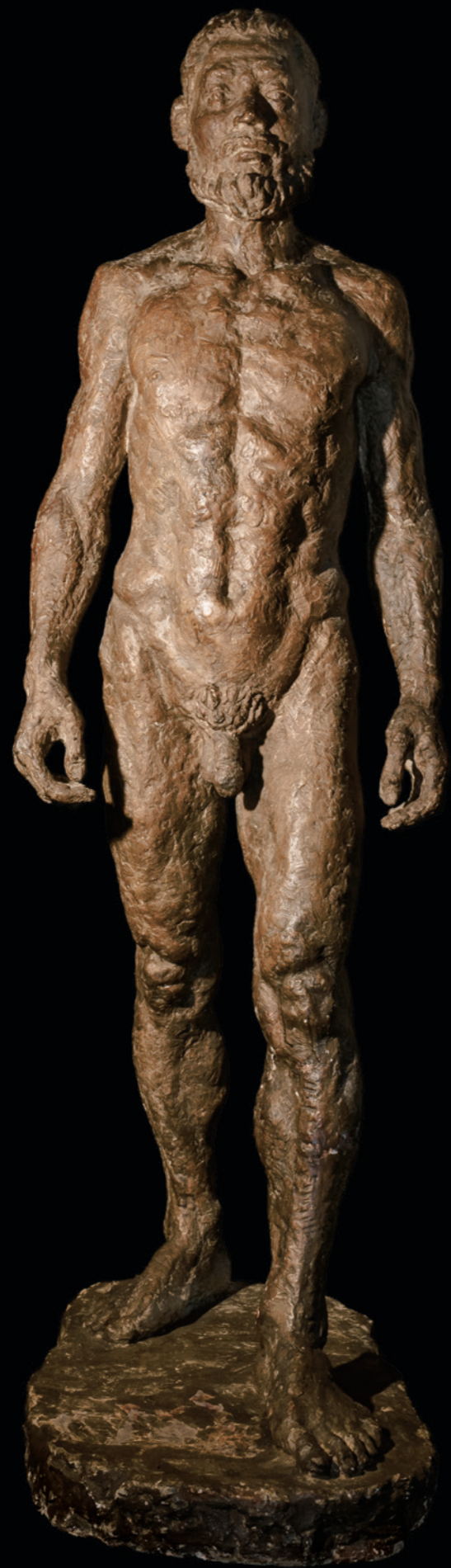
《印度》 H200cm 1980年 21歲