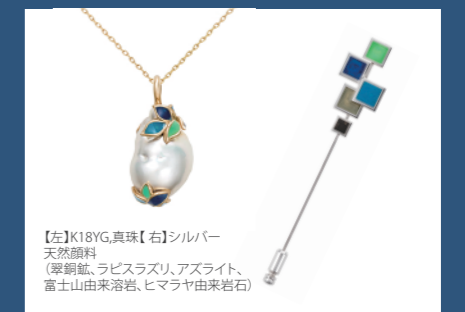
【左】K18YG,真珠【右】シルバー天然顔料(翠銅鉱、ラピスラズリ、アズライト、富士山由来溶岩、ヒマラヤ由来岩石)

橋本弘安名誉教授の研究の一環でもある日本画の岩絵具を生かした作品に携わらせていただきました。ナノ・サブミクロン領域粒子にまで粉碎した翠銅鉱、ラピスラズリ、アズライト、富士山の石、ネパールの石、計5種類の岩絵具を用いてジュエリーを製作。岩絵具をジュエリーに用いるのは初めてでしたが、職人と何度もやり取りしながら進めました。ラピスラズリの壁プロジェクトから発想した、四角いタイルを組み合わせたラベルピンと、稲田先生の日本画作品に因んだ植物イメージのペンダントトップが完成。気軽に持ち運べる日本画として、天然岩絵具の色彩の魅力ジュエリーを通して伝えることができるように、バランスを計算しながら創り上げました。