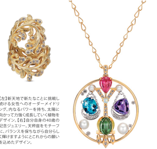
【左】新天地で新たなことに挑戦し続ける女性へのオーダーメイドリング。内なるパワーを持ち、太陽に向かって力強く成長していく植物をデザイン。【右】自分自身の40歳の記念ジュエリー。天秤座をモチーフに、バランスを保ちながら自分らしく輝けますようにとこれからの願いを込めたデザイン。