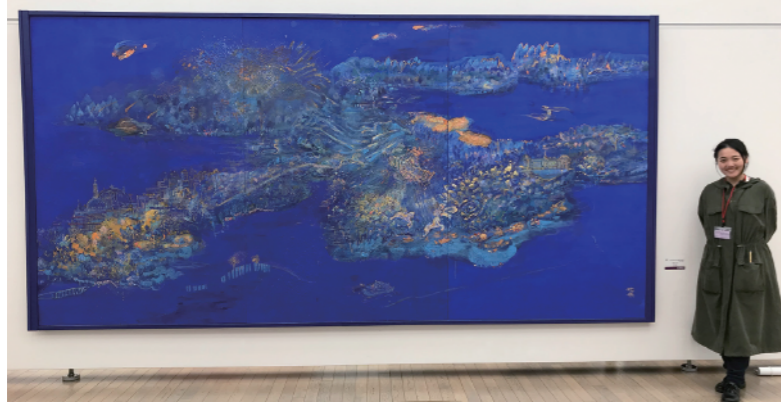
「今夜の月が」 シュ チェン 2019年 194×390.9cm

大学院は博士前期・後期課程で組織され、本学日本画研究の3つの柱である日本画表現研究・素材研究・古典研究をより専門的に据え、次代の日本画の創造を目指します。