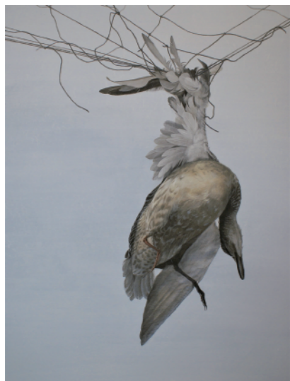
第2回新日春展 奨励賞 「わたり」 F50号 2018年制作

個展やグループ展における作品発表を精力的に続けながら、全国規模の公募展をはじめ、様々なコンクール展の入選・受賞を足がかりとし、日本画家として活躍する卒業生が数多くいます。本学では海外への留学費を設けるなど、手厚いサポートを行っています。