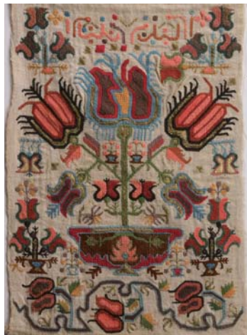
男性の帯、チューリップ

オスマン帝国時代から代々受け継がれてきた刺繍の中で、19世紀から20世紀にかけて制作されたナプキンやカバー、タオルなどの貴重な作品を約50点展示します。トルコの国民はほとんどがイスラム教徒。信仰心の篤い女性たちは頭髪をスカーフで隠します。美しい縁飾り(オヤ)のついでにスカーフを約270点、モチーフの名前や技法別の説明を添えてご紹介します。"ビーズの縁飾り研究会"は、ボンジュックオヤの美しさと実用性に注目してモチーフや編み方を研究し、手軽に作って楽しめるようにアレンジしました。作品展示と併せて、体験もお楽しみください。