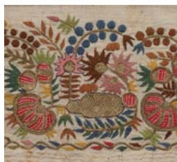
タオル・ザクロの花と実のモチーフ