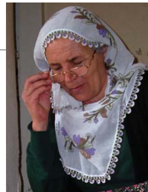
ボンジュックオヤ ビーズを入れたオヤは、適度な重みもあって実用的。