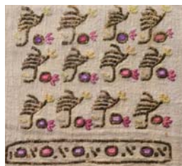
ナプキン・鳥のモチーフ