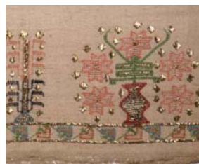
ナプキン・生命の木のモチーフ