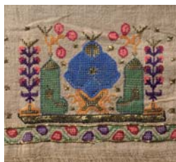
ナプキン・モスクのモチーフ

子孫繁栄、健やかな成長、戦地での夫の無事など、様々な願いが込められている抽象化された図案や、銀糸を使用した技法が特徴です。