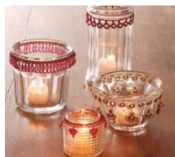
キャンドルホルダー