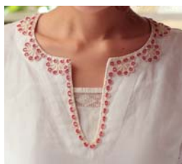
チュニックをリメイク