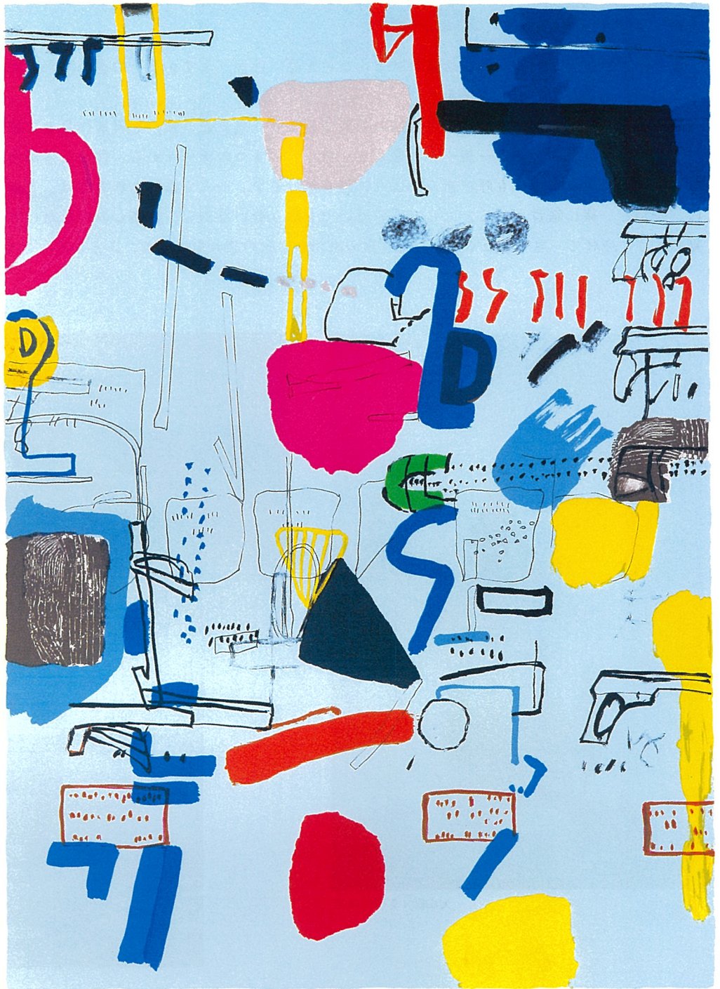
佐野ぬい《午後のシティ・タイム》1993