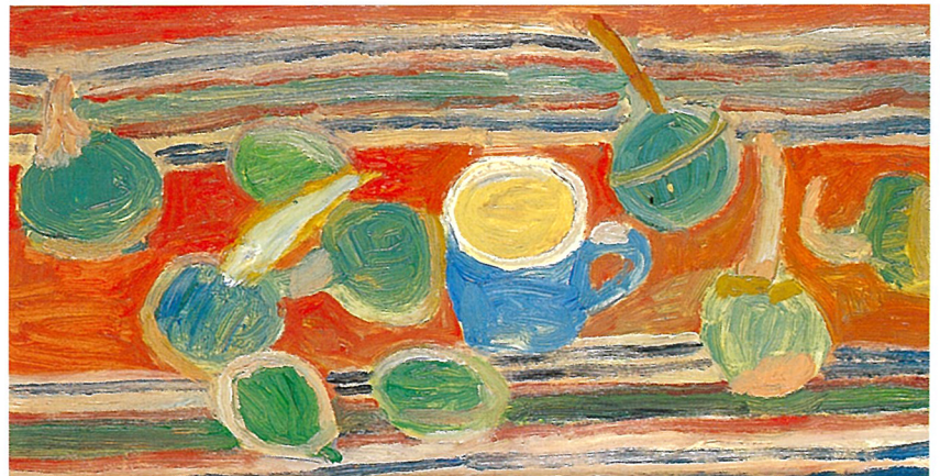
甲斐仁代《くわいなど》1959