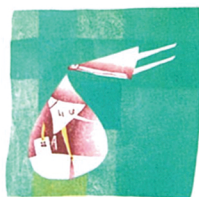
野村千夏 《くっかない...》2008 ©Chinatsu NOMURA