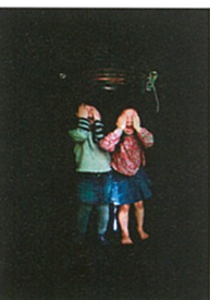
野口香子 《ジュリエット&マリーオード》 《In bottle》より 2010