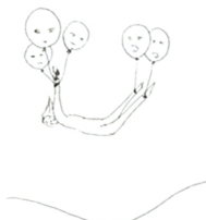
新津亜土華 シリーズ 《Break the gold chain that I gave U.》より 2010 ©Adoka NIITSU