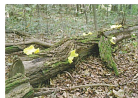
松山聖子 《o.T》2010 ©Shoko MATSUYAMA