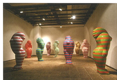
いしばしめぐみ 《くよこしま》2002 ©Megumi ISHIBASHI