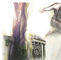
高木彩 《Trace (痕跡)》2008 ©Aya TAKAGI