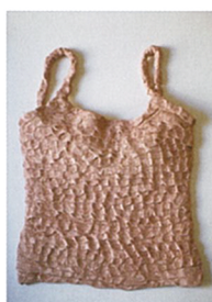
保科晶子 《Combinaison シュミーズ》2008 ©Akiko HOSHINA