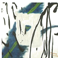
橋本美智子 《朝の市》2009 ©Michiko HASHIMOTO