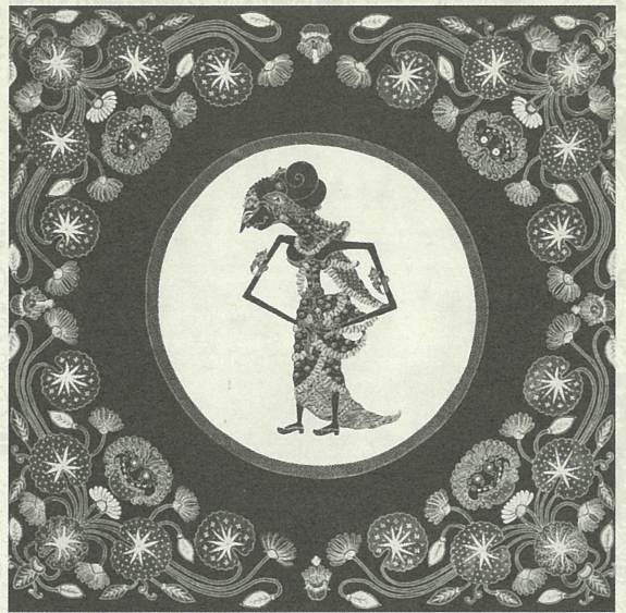
ワヤン人形模様パティック 20世紀 ジャワ島