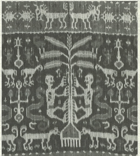
人物動物模様イカット(部分) 20世紀 スンバ島