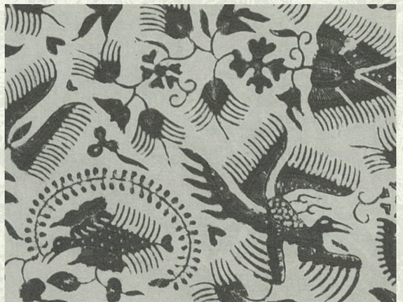
花鳥模様パティック(部分) 20世紀 ジャワ島

表面図版 上: 花鳥模様パティック(部分) 20世紀 ジャワ島 下: 鶏とカニ模様イカット(部分) 20世紀 スンバ島